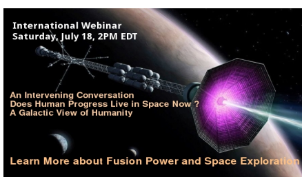
International Webinar Learn More about Fusion Power and Space Exploration July 17, 2020