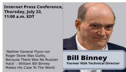
William Binney Makes His Case To The World: There Was No Russian Hack July 23, 2020