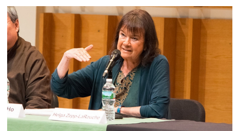
Video - Why a U.S., China, Russia and India Summit is Urgently Needed Now July 8, 2020