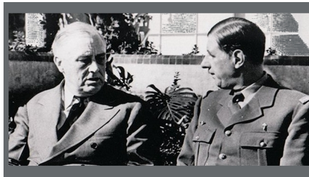
Ce parfum de Roosevelt et de De Gaulle qui incommodent la City de Londres 16 juillet 2020