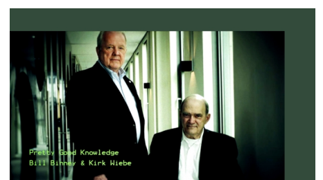
Responses to William Binney's Press Conference July 25, 2020