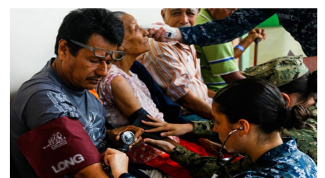
Coronavirus Petition: For Global

Pétition de l'Institut Schiller pour la mise en place d'une infrastructure sanitaire mondiale