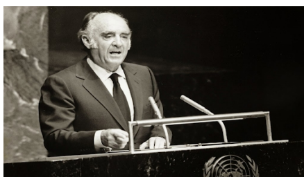
Discours historique du président Lopez-Portillo sur la dette devant l'ONU 1er octobre 1982