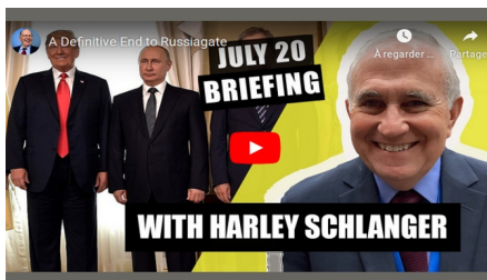
A Definitive End to Russiagate July 20, 2020