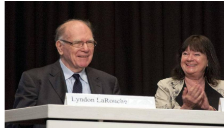
La Fondation Lyndon LaRouche mobilisée pour sa réhabilitation

“We understand how important it is to strengthen friendship and trust between nations and are open to dialogue and cooperation on most pressing issues on the international agenda. Among them is the creation of a common reliable security system, something the complex and rapidly changing modern world needs. Only together can we protect the world from new dangerous threats.”