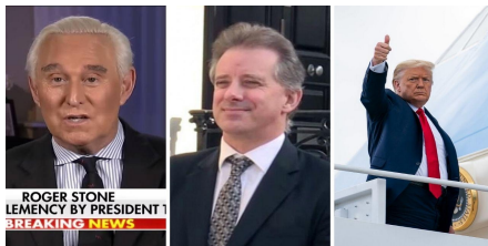
The British Declare, Yet Again, 'We Run the Coup' Against Donald Trump