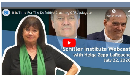
It Is Time For The Definitive Crushing Of Russiagate July 22, 2020