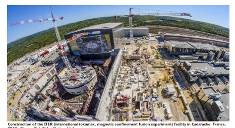
Create 50 Million American Jobs To Rebuild the World

Space Exploration; The Radical Change We Need - July 16, 2020